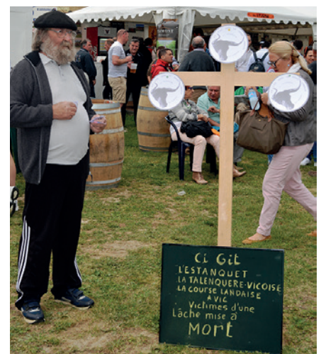
Pentecôte 2015 - Parvis des arènes

tous qu'il en sera de même pour La Talenquère.