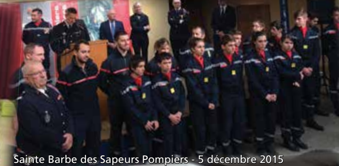
Sainte Barbe des Sapeurs Pompiers - 5 décembre 2015