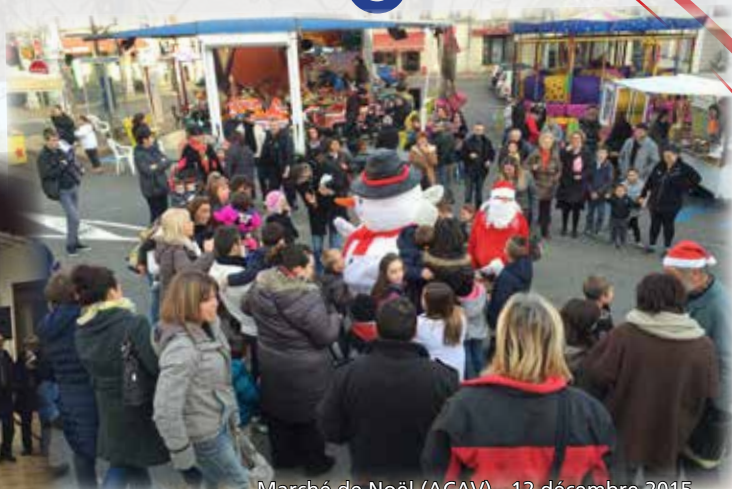
Marché de Noël (ACAV) - 12 décembre 2015