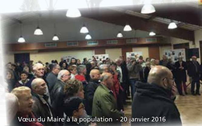
Vœux du Maire à la population - 20 janvier 2016