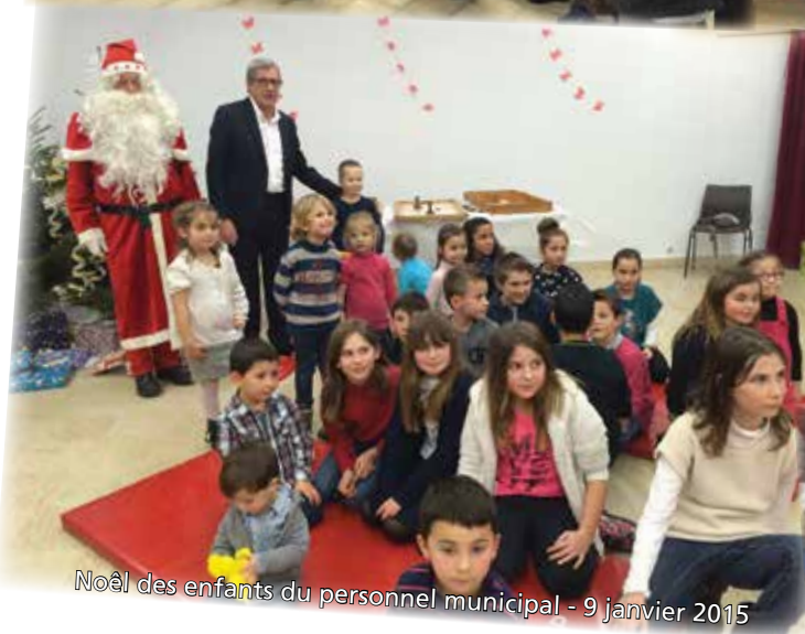
Noël des enfants du personnel municipal - 9 janvier 2015