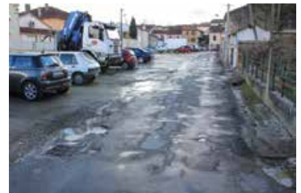
rue des Tisserands

A ce jour, hormis des travaux urgents de remise en état suite aux intempéries ou autre, et sauf oubli de notre part, pas un mètre carré de voirie urbaine n'a été rénové !