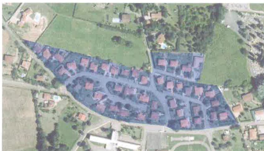
Fig. 17. Exemple de densité existante sur le lotissement voisin